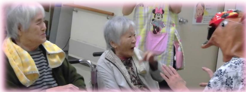
鬼退治が一番上手な 系 様(中央)