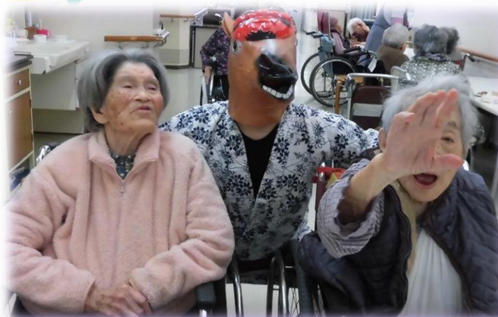
鬼と仲良くスリーショット