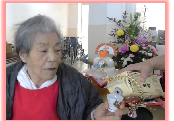
お正月に、お神酒を頂きました