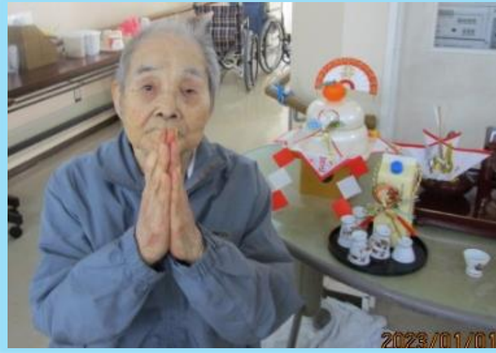
お屠蘇を前にして神聖な気分になられたのでしょうか