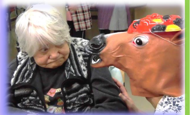
不審人物に驚かれる森崎 様