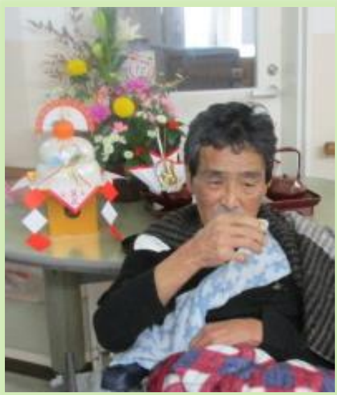
お神酒を飲んで舌鼓を打ち、じっくり味わっておられました。