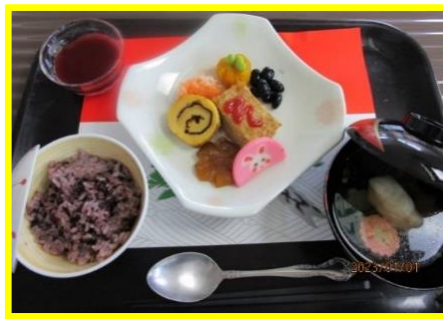
元日の御祝い膳です