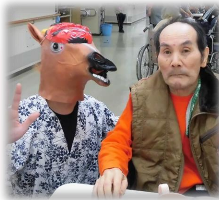
鬼とツーショット