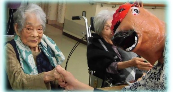
鬼とも仲良くして下さいました