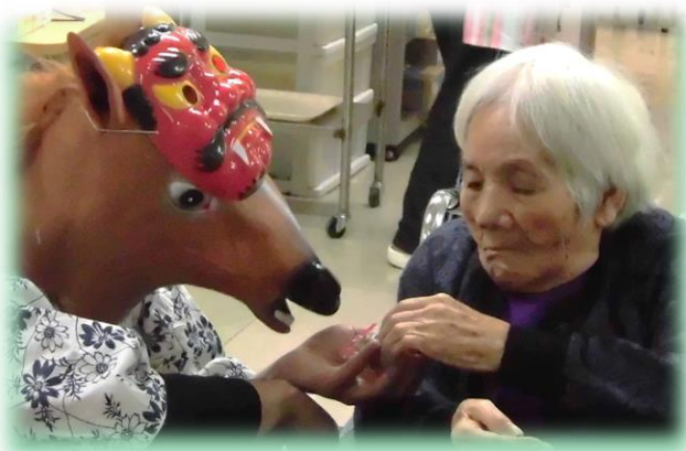
誰にでも 分け隔てなくお裾分け